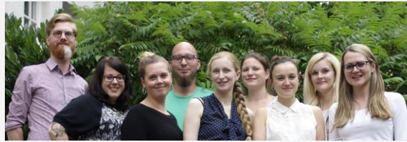
Unser Team am Institut für Sachunterricht, Schwerpunkt Gesellschaftswissenschaften.