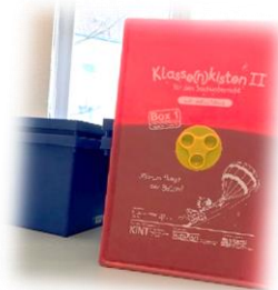
Experimental- und Klassenkissen zu unterschiedlichen Themen