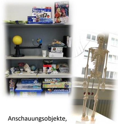
Anschauungsobjekte, Mikroskope, Lernspiele u.v.m.!