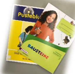
Lehrwerke und Werkstätten für alle Perspektivbereiche für die Klassen 1-4