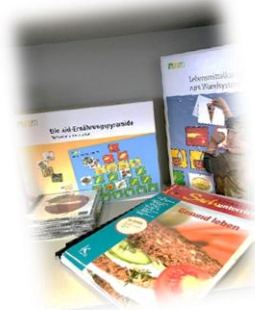
Fachwissenschaftliche und fachdidaktische Literatur für perspektivnetzende & perspektivbezogene Themen