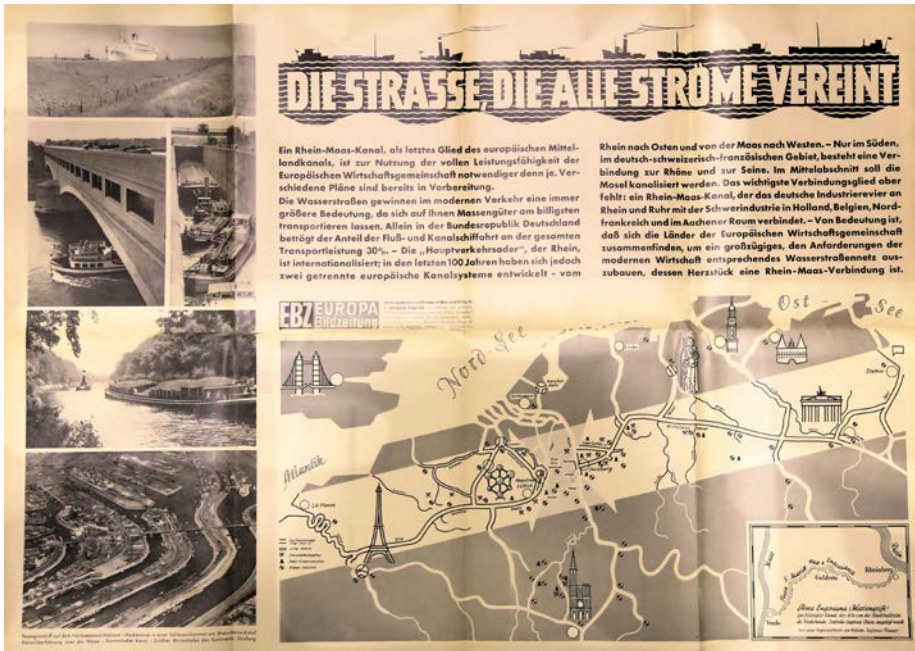
Abb. 4: Werbeplakat zum R-M-Kanal. In: Bestand: Abt. 1, Nr. 732, 3, Wirtschaftsarchiv Köln.

Die zweite Begegnung, bei welcher es zumindest zu einem persönlichen Austausch der beiden kam, fand im April 1960 auf eine Einladung des nordrhein-westfälischen Ministerialdirigenten Schäfer hin statt.